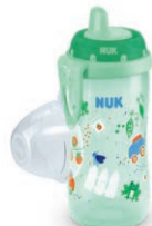
NUK Kiddy Cup