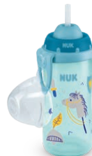
NUK Flexi Cup