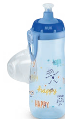
NUK Junior Cup